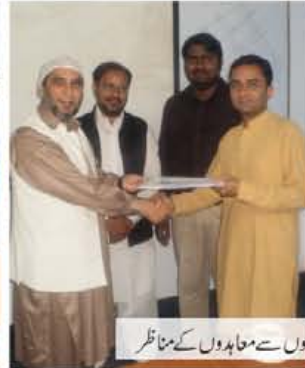
ایجوکیشنل سروسز کے مختلف اسکولوں سے معاہدوں کے مناظر