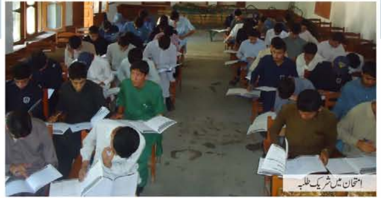
امتحان میں شریک طلبہ