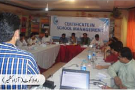
راولپنڈی (آزاد کشمیر)