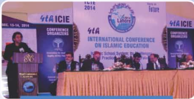
Some glimpses of the conference.

The conference called upon the teachers of Islamic schools to take greater responsibility to not only promote sound academic education but also develop learners' religious sensibility. The conference recommended the government make character building of students in schools its highest priority. It said that character building should be according to the Quranic principles not the western ideas.