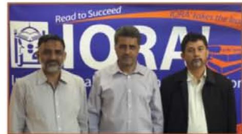
The AFAQ delegation on a visit to IQRA, Chicago.