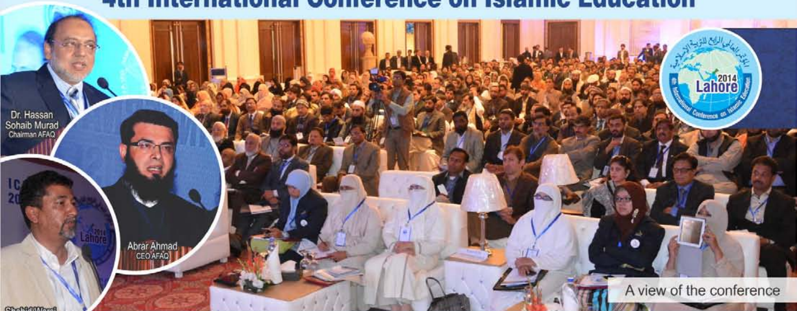
A view of the conference