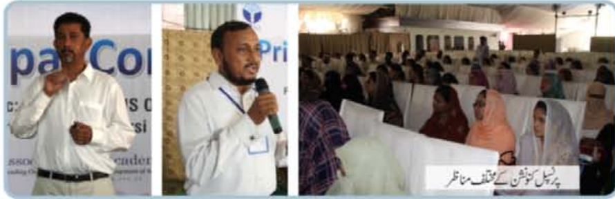
پرنسپل کنونشن کے مختلف مناظر