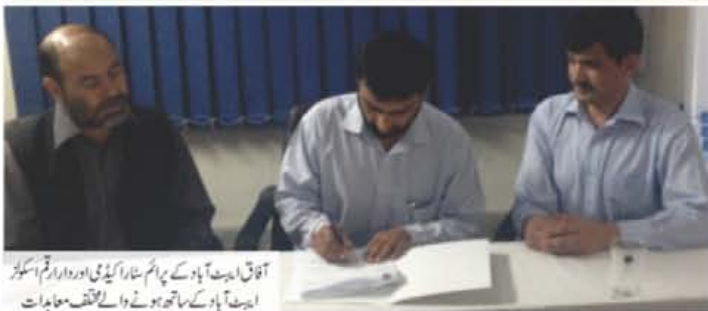
آفاق ایبٹ آباد کے پرائم سٹار اکیڈمی اور دارالرقم اسکول ایبٹ آباد کے ساتھ ہونے والے مختلف معاہدات