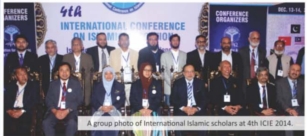
A group photo of International Islamic scholars at 4th ICIE 2014.

On 13 th December, 2014, the first day of the conference, visitors started to come even before 9:00 am, and during primary hours, there were more visitors than the seating capacity. Among them were the heads of educational institutes, principals, owners of different school chains and scholars.