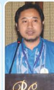
Sapto Supharjo Soedarto Indonesia