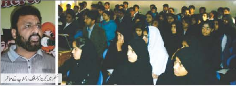
سکھر میں کیریئر کونسلنگ ورکشاپ کے مناظر

آفاق سکھر نے روٹری پبلک اسکول اور اسکول آف ایکلیٹس سکھر میں کیریئر کونسلنگ ورکشاپوں کا انعقاد کیا۔ پرنسپل سندھ کالج سکھر نے اس موقع پر آفاق کے اسٹال کا دورہ کرتے ہوئے آفاق کی خدمات خاص طور پر کیریئر کونسلنگ کی سرگرمیوں کو سراہا۔ آگاہی سے متعلق مختلف ورکشاپوں سے خطاب کرتے ہوئے ریجنل میجر اور ایس مین نے کہا کہ آفاق کیریئر کونسلنگ کا مقصد یہ ہے کہ طلبہ زندگی کے مختلف شعبوں میں اپنی شخصیت کو نکھار سکیں اور کامیابی ان کا مقدر بن جائے چنانچہ اس شعبے کی تعلیمی و عملی زندگی میں اہمیت بہت بڑھ گئی ہے۔