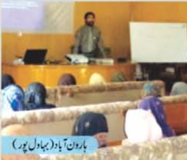
ہارون آباد (بہاول پور)

کلاس روم کسی بھی تعلیمی نظام میں بنیادی اہمیت کا حامل ہوتا ہے خواہ وہ اصحاب صفحہ کا نظام ہو یا آج کا جدید نظام تعلیم ہو۔ اس لیے کلاس روم کے بنیادی لوازمات کو سمجھے بغیر گزارا ممکن نہیں ہے۔ کلاس روم کی اس اہمیت کے پیش نظر آفاق نے نیلم (آزاد کشمیر)، خیر پور، خان پبلہ ہارون آباد، فقیر والی اور رحیم یار خان میں کلاس روم مینجمنٹ ورکشاپوں کا انعقاد کیا۔ ان ورکشاپوں میں کلاس روم مینجمنٹ کے متعلق اساتذہ کو تربیت دی گئی۔