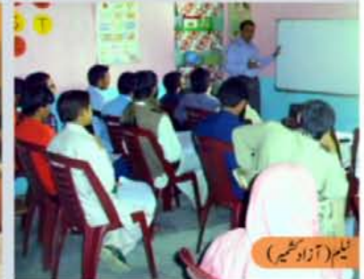
نیلم (آزاد کشمیر)